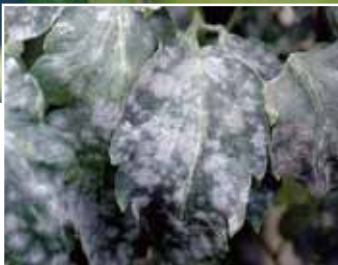
トマトうどんこ病