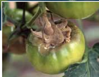
トマト灰色かび病