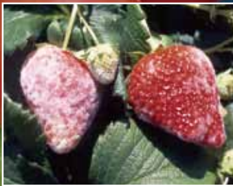
いちごうどんこ病

うどんこ病・灰色かび病（野菜類）・葉かび病（トマト、ミニトマト）に微生物パワー＋銅の効果