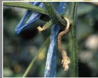
きゅうり灰色かび病