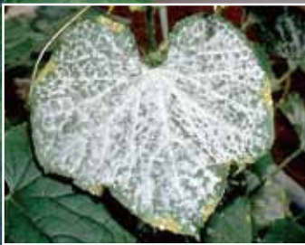
きゅうりうどんこ病